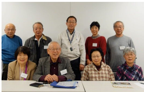
▲市民後見人の皆さん

令和7年12月10日（水）までに電話で、志木市基幹福祉相談センター（後見ネットワークセンター）へ 電話：048-456-6021