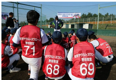
▲過去に開催した野球教室の様子